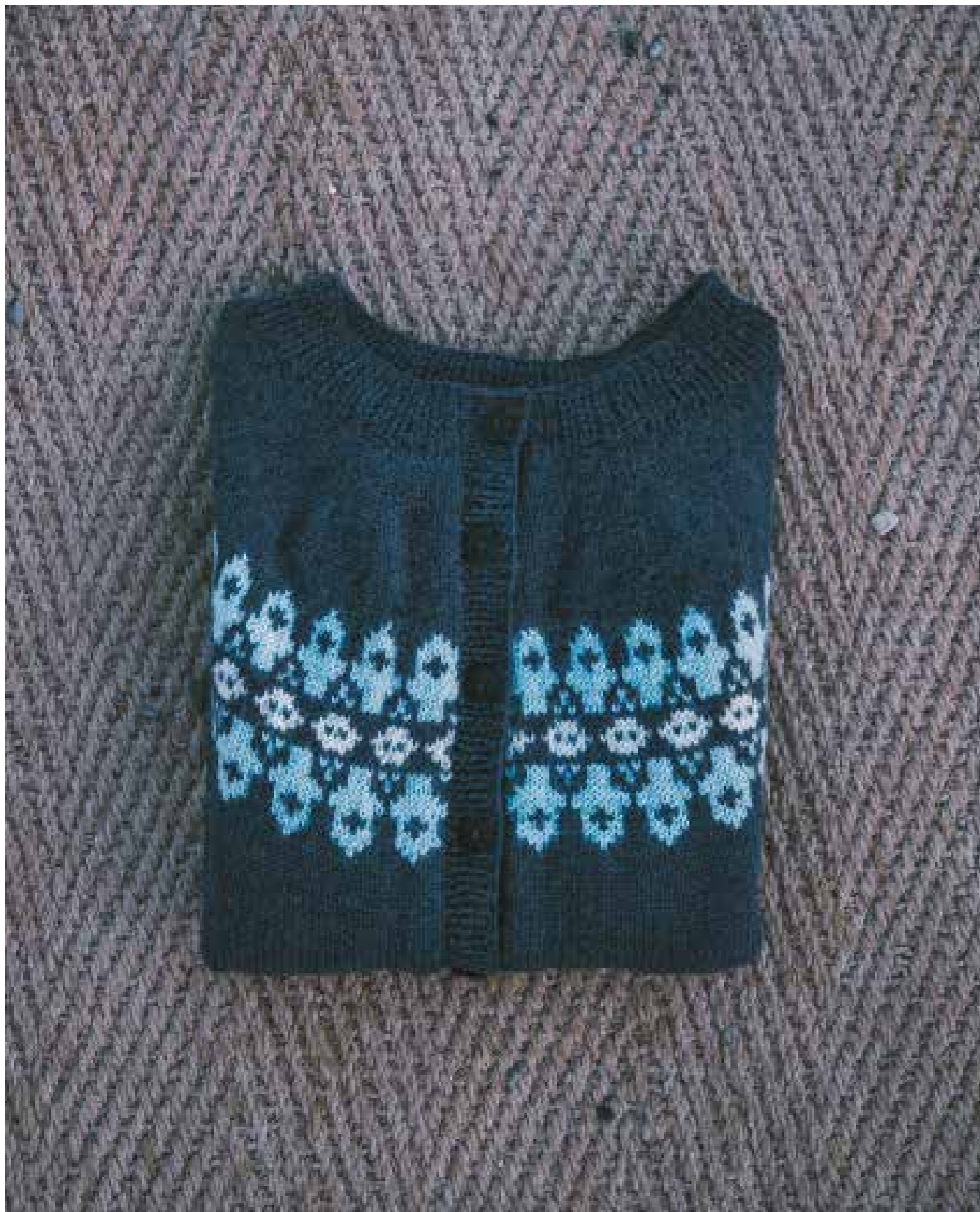
ALPAKKA GRÄBLÄ 6071