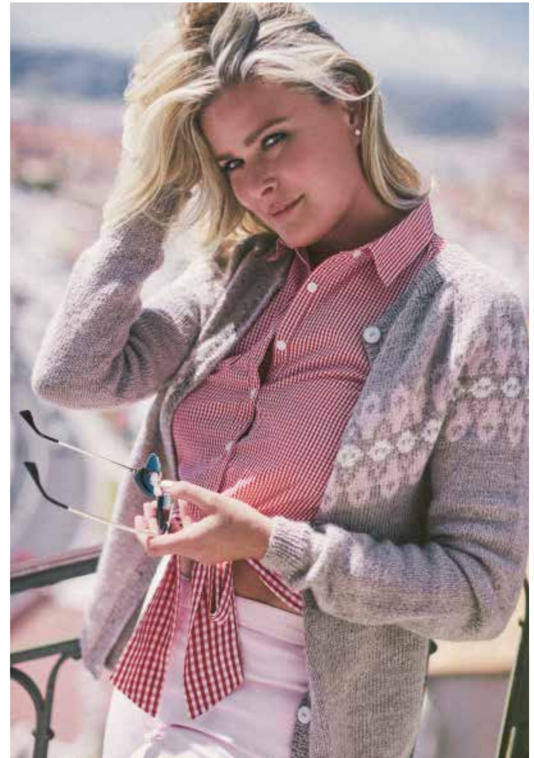
ALPAKKA GRÄBEIGE MELERT 2650